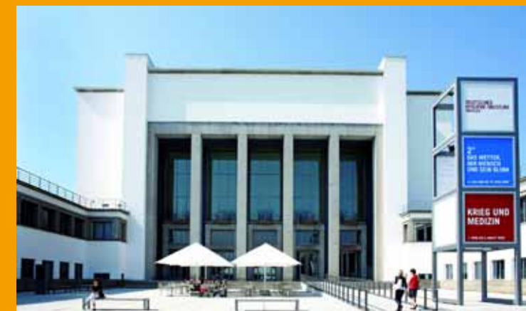
Deutsches Hygiene-Museum Dresden

Fördern. Bewegen. Gestalten. Stiftungen in Sachsen